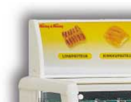
Lisavarustusena valguskast külmriiuli ülaosas